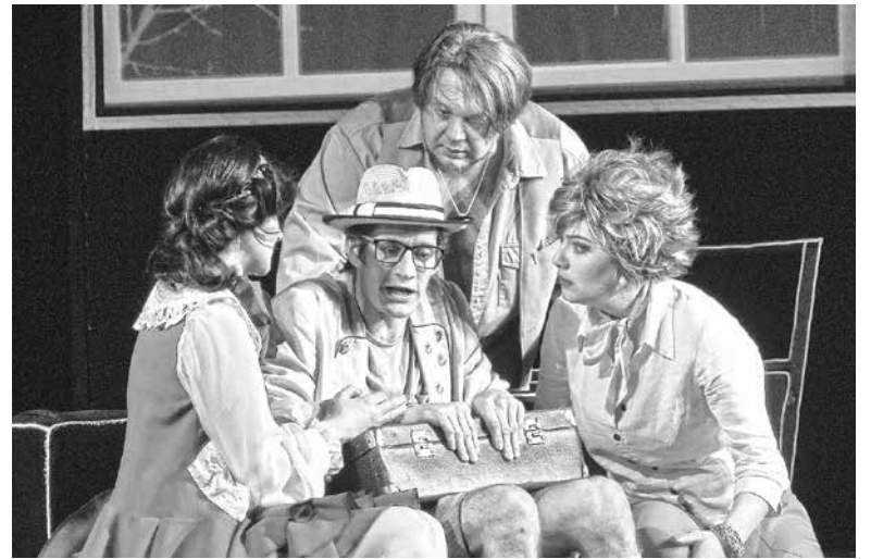
Вічні питання цінності грошей, дружби та сім'ї неодноразово постають перед героями вистави «Смішні гроші»

Гроші чи повсякденність? Солодке життя чи сім'я та