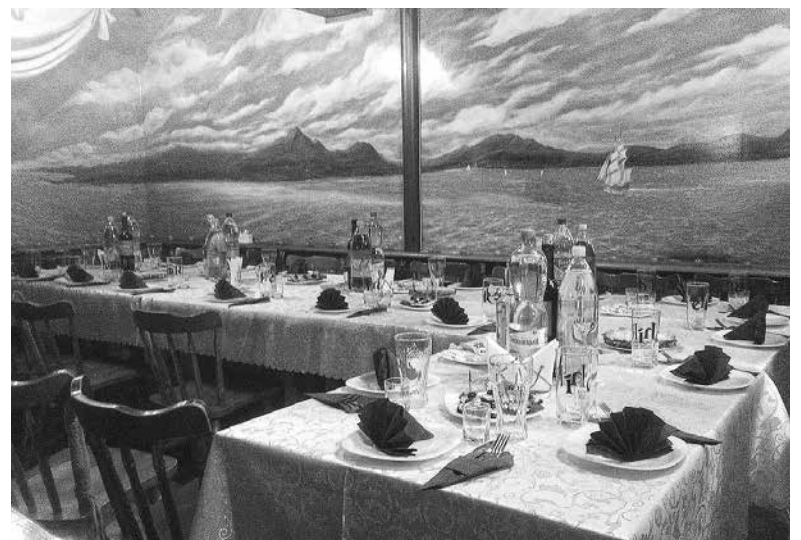
Морський пейзаж на стінах додає відчуття трапези на кораблі