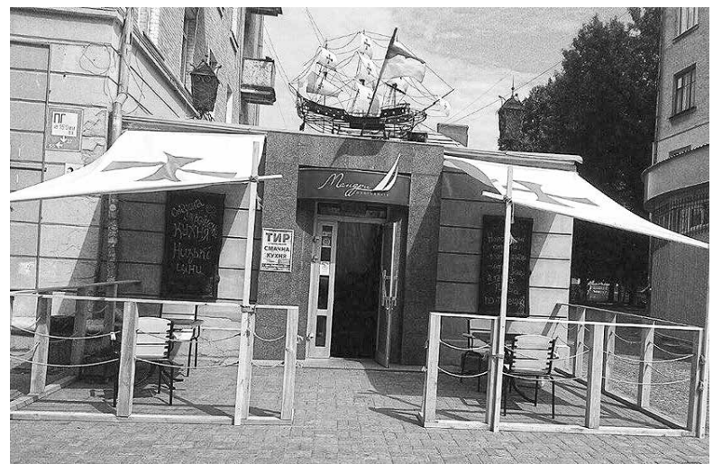
Інтер'єр ресторату нагадує палубу корабля

Смачні страви, тиха музика, приязний персонал – це як мінімум перша причина відвідати «Мандри». Якщо ви мрієте про морську подорож, але не маєте коштів на це – завітайте у «Мандри»: кулінарна мандрівка кухнями світу на тлі морської атмосфери вам забезпечена, ну а неймовірно затишний та комфортний відпочинок із родиною завжди гарантований. Навіть якщо ви захочете влаштувати романтичну вечерю з дружиною чи чоловіком, можете бути спокійні за малечу, адже ваша дитина тут буде під наглядом та наїжена. Ресторату має дві зали, тому даруючи хвилини романтики своїй дорогій половинці, ви можете бути цілком спокійні за своє чадо, яке неподалік гратиметься зі своїми ровесниками.