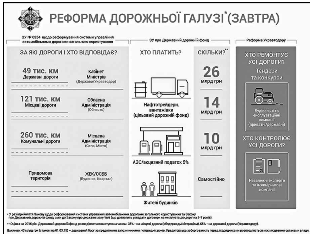
Мал. №1 Реформа дорожньої галузі України.

Не слід забувати, що асфальтний завод КП УАШ, як більшість аналогічних радянських підприємств, технологічно залишився на рівні 70 років минулого століття. Застаріле обладнання, що конче потребує модернізації зі скороченням щонайменше на 30% споживання енергоресурсів, несе велику екологічну небезпеку. Найближчим часом його чекає перевірка на придатність для використання в міській зоні, яку він без переобладнання навряд чи пройде. Чи готова буде до цього виклику прийдешня міська влада – залишається великою загадкою.