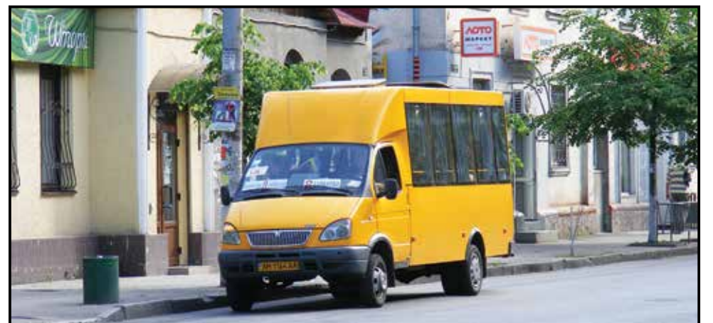
■ Маршрутки знову повернули на Київську

Транспортна реформа, яку так натхненно й наполегливо втілює у життя Житомирська міська рада, приховує в собі чимало небезпек. У цьому переконані житомирські перевізники.