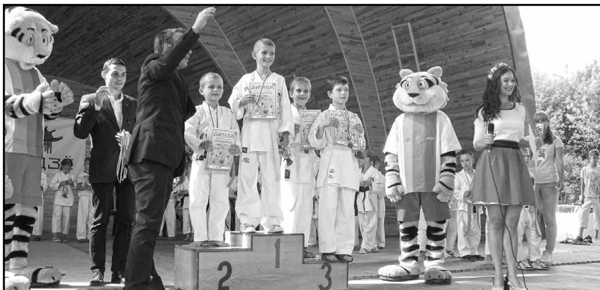
■ Нагородження наймолодших учасників турніру