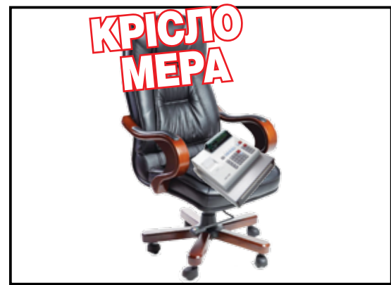
Сплати державі 10 тисяч і ти можеш бути мером