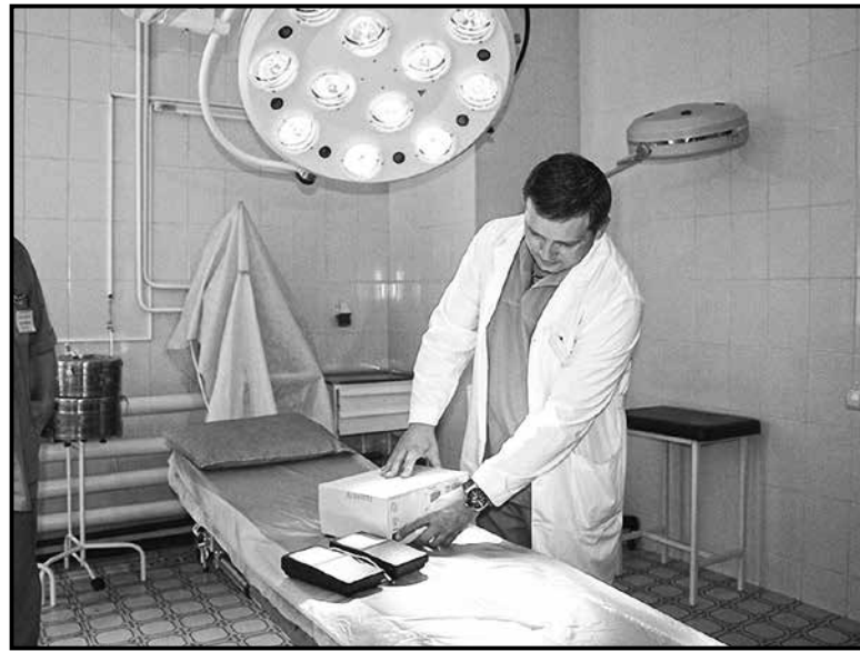
■ Фонд Вілкула допоміг укомплектувати нову операційну Дніпропетровської міської лікарні № 2 – був переданий сучасний електрокоагулятор, необхідний для проведення порожнинних операцій