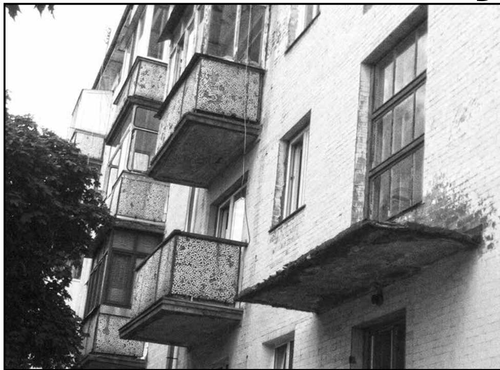
■ Аварійний балкон по вул. Рильського першочергово потребує капітального ремонту. Але кошти в цьому році не виділяли

Наступного року у міській раді все-таки обіцяють вирішити питання щодо балконів, які потребують капітального ремонту.