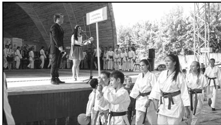
■ Відкриття турніру, парад команд

Загалом турнірний день був переповнений емоціями юних каратистів, тренерів та вболівальників. Були тут і сльози розчарування, і хвилювання, і крики радості, і щирі обійми й привітання товаришів. Спостерігаючи за цим грандіозним дійством, можна впевнено сказати, що спортивний Житомир не стоїть на місці, а розвивається та виходить на міжрегіональний рівень. Сподіваємося, що цей турнір – лише початок становлення нашого міста як одного зі спортивних центрів України.