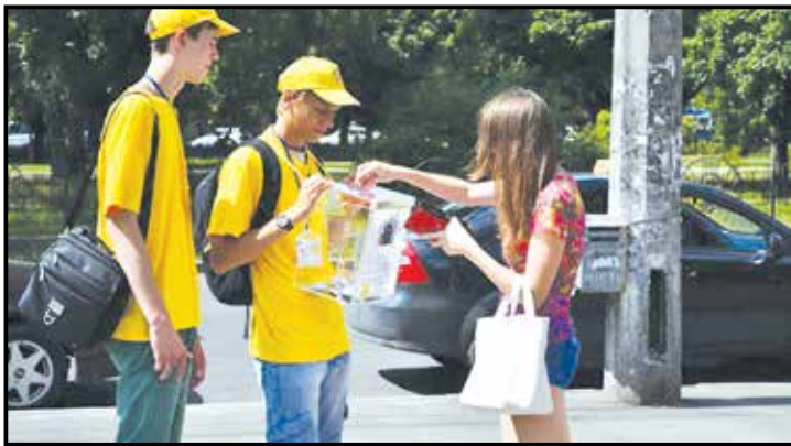
Псевдоволонтери роблять бізнес, прикриваючись благодійністю