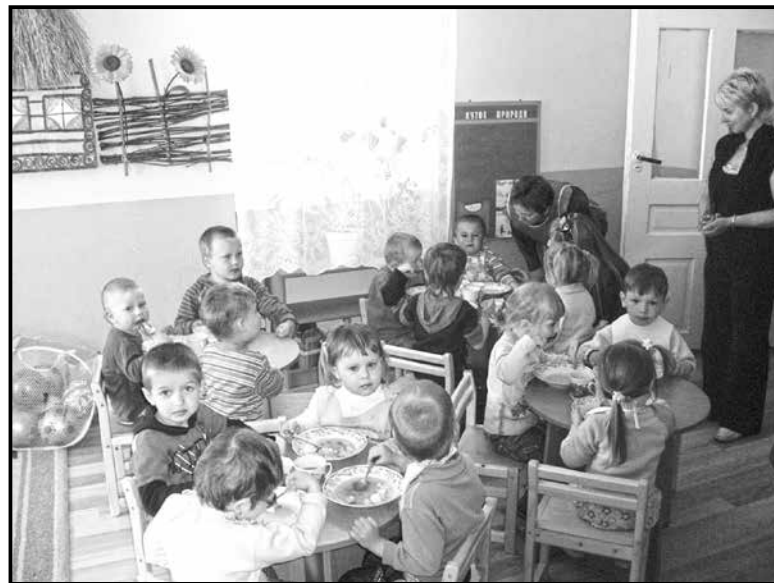
■ В управлінні освіти зазначають, що формування меню входить до обов'язків медичної сестри садочка

І може б не так болісно було віддавати ті кровно зароблені гроші на покращення умов садочку, зізнається Світлана, якби