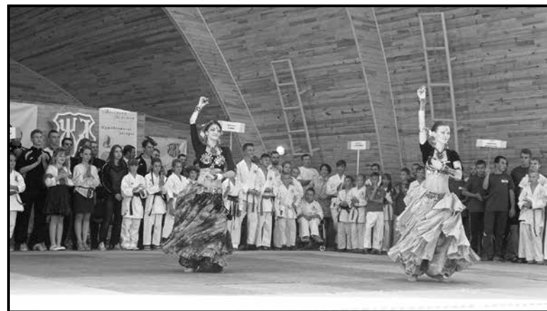
■ Артисти танцювальної студії «Каурі»