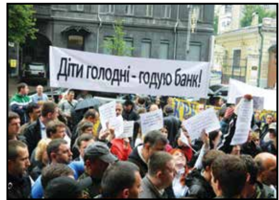
Кредитна пастка, або Чому житомирянам не варто повертати кредити