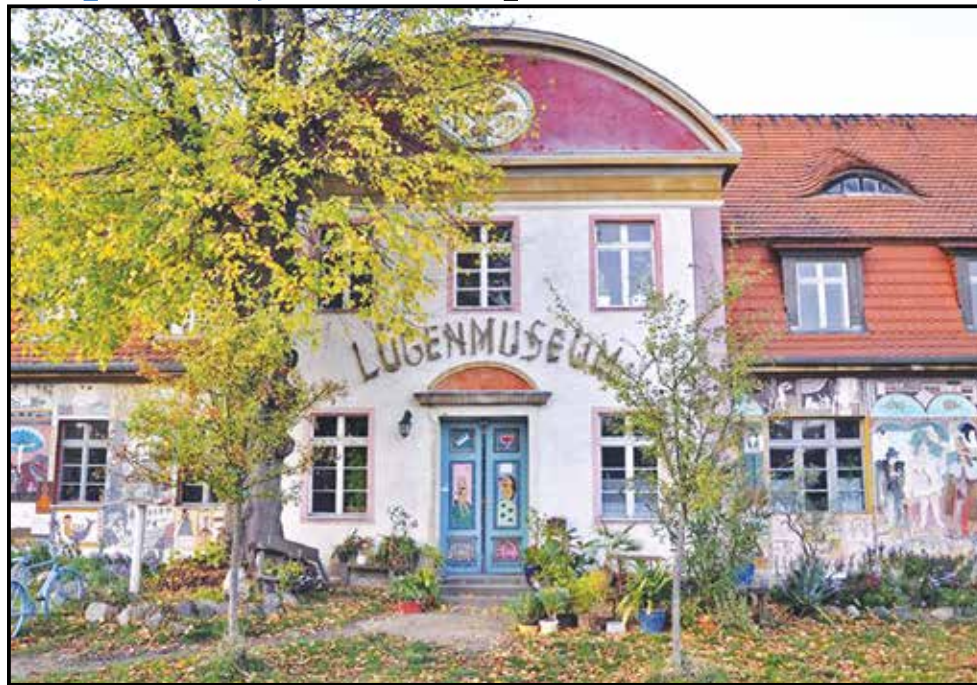
■ Музей брехні в Німеччині

За зовнішнім виглядом музей нагадує звичайний магазин. Біля входу в горщиках ростуть квіти, вивіска нічим особливим не відрізняється. Але опинившись всередині, ви перенесетесь у світ однієї із найдавніших рослин світу. У колекції Музею марихуани представлені тисячі предметів, які розповідають про багатовікову історію марихуани, її поширення світом і використання людиною. Тут і книги з медицини з рецептами і описами хвороб, які виліковуються за допомогою цієї трави, і література про проблему наркоманії та про історію легалізації марихуани, а також стильний і красивий одяг, пошитий з екологічно чистої і довговічної конопляної тканини. У скляних вітринах представлені десятки зразків курільних трубок буквально з усіх куточків світу.