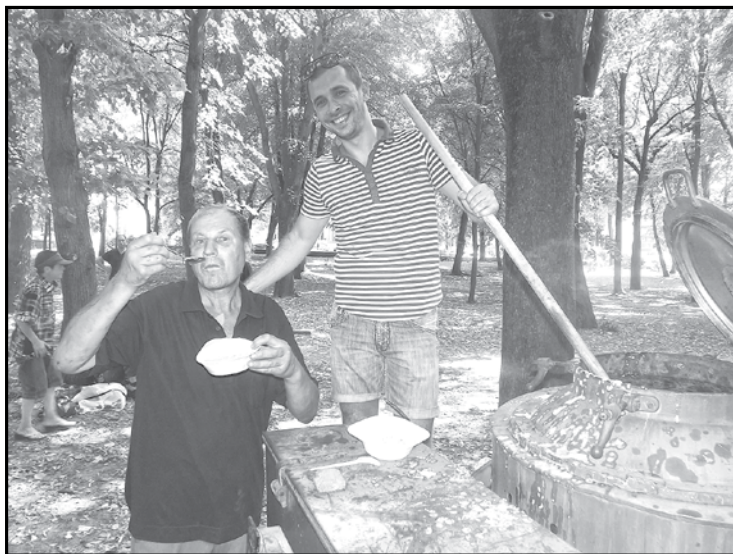
■ Безпритульні розповіли, що їжа приготована «смачно й з душею»