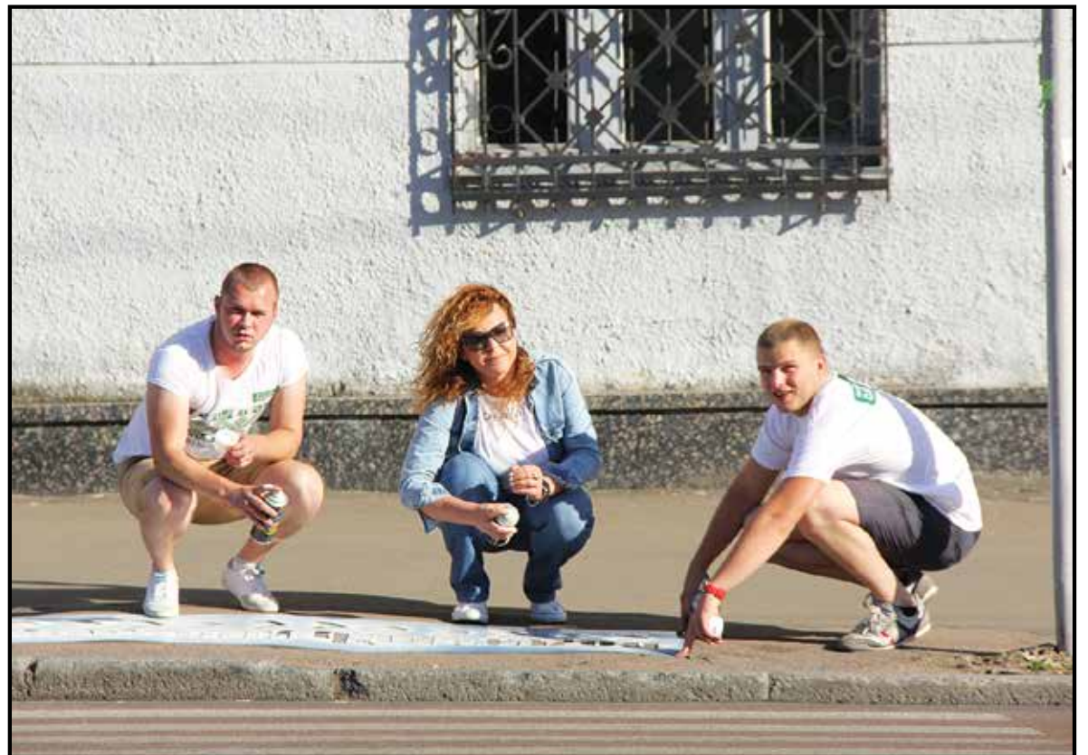
■ «Безпечне місто» - проект «Об'єднання «Самопоміч», мета якого показати, яким чином можна зробити життя містян більш безпечним

Також зверталися до водіїв транспортних засобів із закликами «Швидкість 40 км». Активісти «Самопоміч», які стояли на тротуарі з обмежувальним знаком швидкості до 40 км/год, інформували водіїв, що за швидкості 60 км/год, які