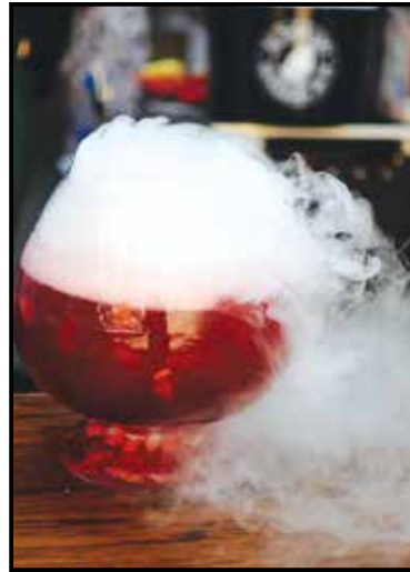
■ Димний пунш, яким пригощали житомирян

Практика проведення фестивалів вуличної їжі існує в усьому світі. В Україні подібні заходи проводилися лише у містах-мільйонниках – Києві, Львові, Одесі тощо. Тепер і житомиряни мали нагоду перенестися у дитинство та насолоджуватися смачними стравами, які роздавали безкоштовно, або ж за собівартістю.