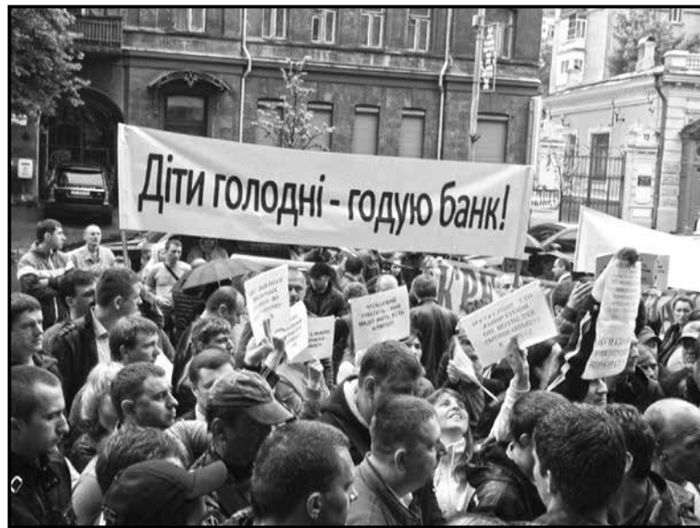
■ «Фінансовий майдан» проти фінансового рабства

Нагадаємо, що в минулому номері газети «20 хвилин» вже розповідалось про те, як банки ошукують людей, які свого часу взяли кредити. Адже ці кошти вже давно списані, а на них купується долар і тим самим