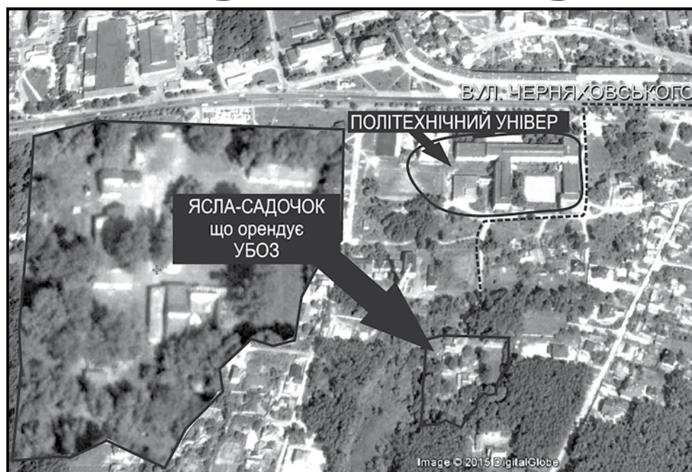
■ Фото №3, карта розміщення ясли-садочка, що орендується УБОЗ Житомирського УМВС

Останніми роками УМВС в Житомирській області не тільки зберегло та утримує за власний рахунок відомчий ДНЗ № 17, але й спромоглося «підім'яти» ще декілька колишніх дитячих садочків. В одному з них, колишньому ДНЗ № 12 по вул. Шелушкова, 112а,