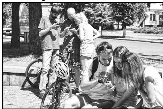
■ Бажаючі змогли взяти участь у пішохідному квесті

На фініші організатор квесту пригощав усіх цукерками, а призерам вручив грамоти.