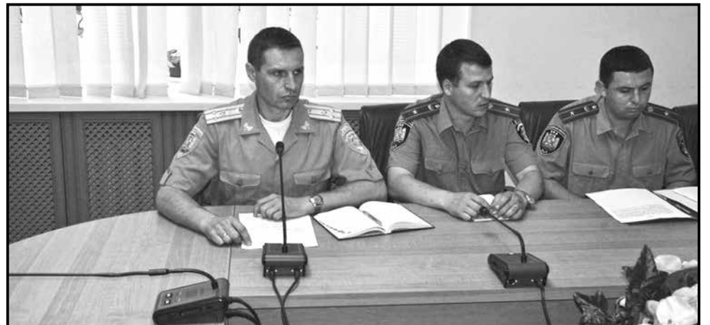
■ Керівники державної пенітенціарної служби на зустрічі з громадськістю