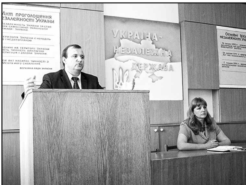
■ Приклади заборони продажу алкоголю військовим – Шатило

запевняють, що запорукою рентабельності та потрібності електрички стане цінова політика. Чиновники вже задекларували, що вартість квитка на потяг становитиме не більше 35 гривень. Тоді як у маршрутному таксі доводиться платити 80 гривень.