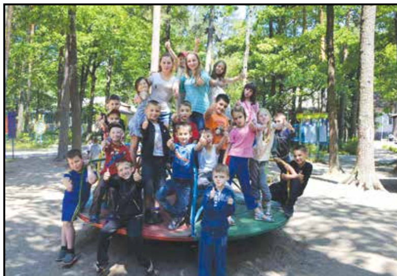
■ Уже майже 300 дітей з сімей учасників АТО отримали путівки в приміський табір «Супутник»

Відпочинок за кордоном для дітей учасників АТО також можливий. Але через те, що на це бюджетні кошти не витрачаються, точної кількості дітей, які поїхали до іноземних дитячих таборів, ніхто назвати не може.