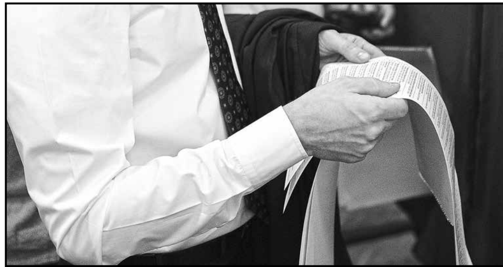
■ Вибори мера у Житомирі будуть двотуровими