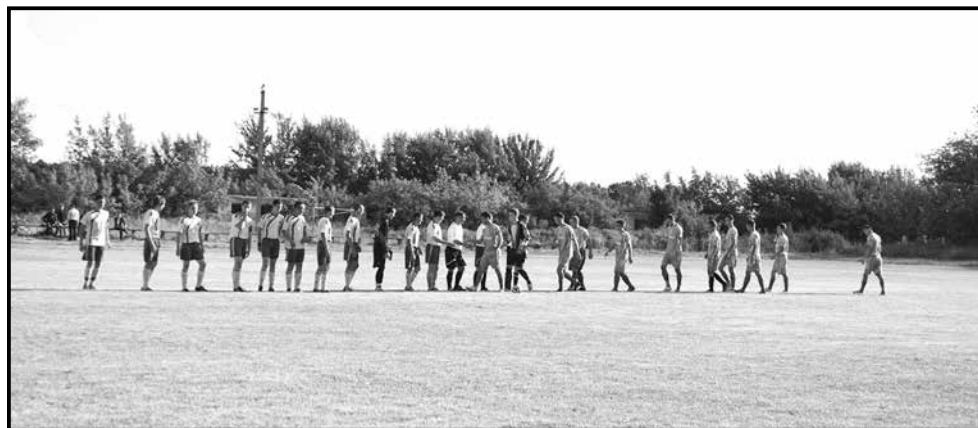
■ 9 тур першості Житомирської області