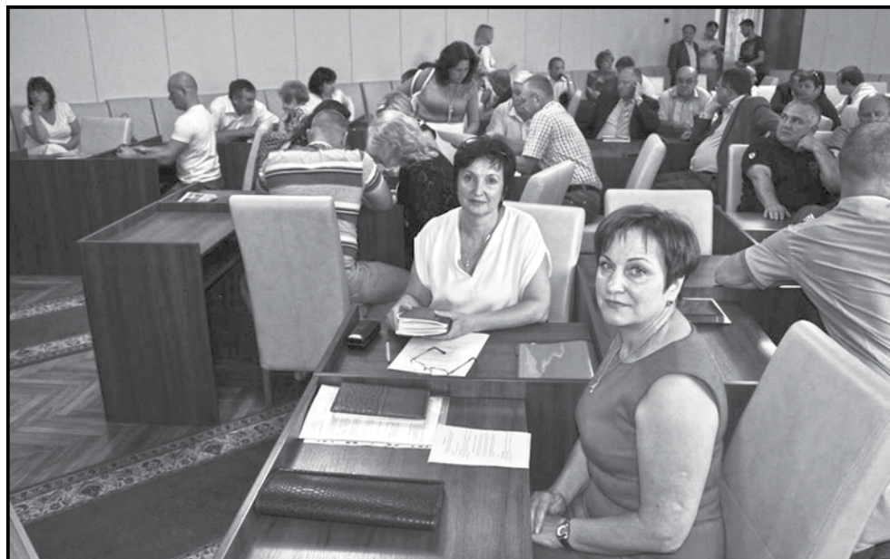
■ Зустріч громадськості із губернатором області